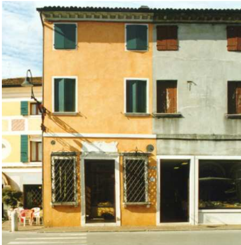
La casa ora Zalgelli conserva l'iscrizione Locus comunitatis Anolis MDLXXXVIII