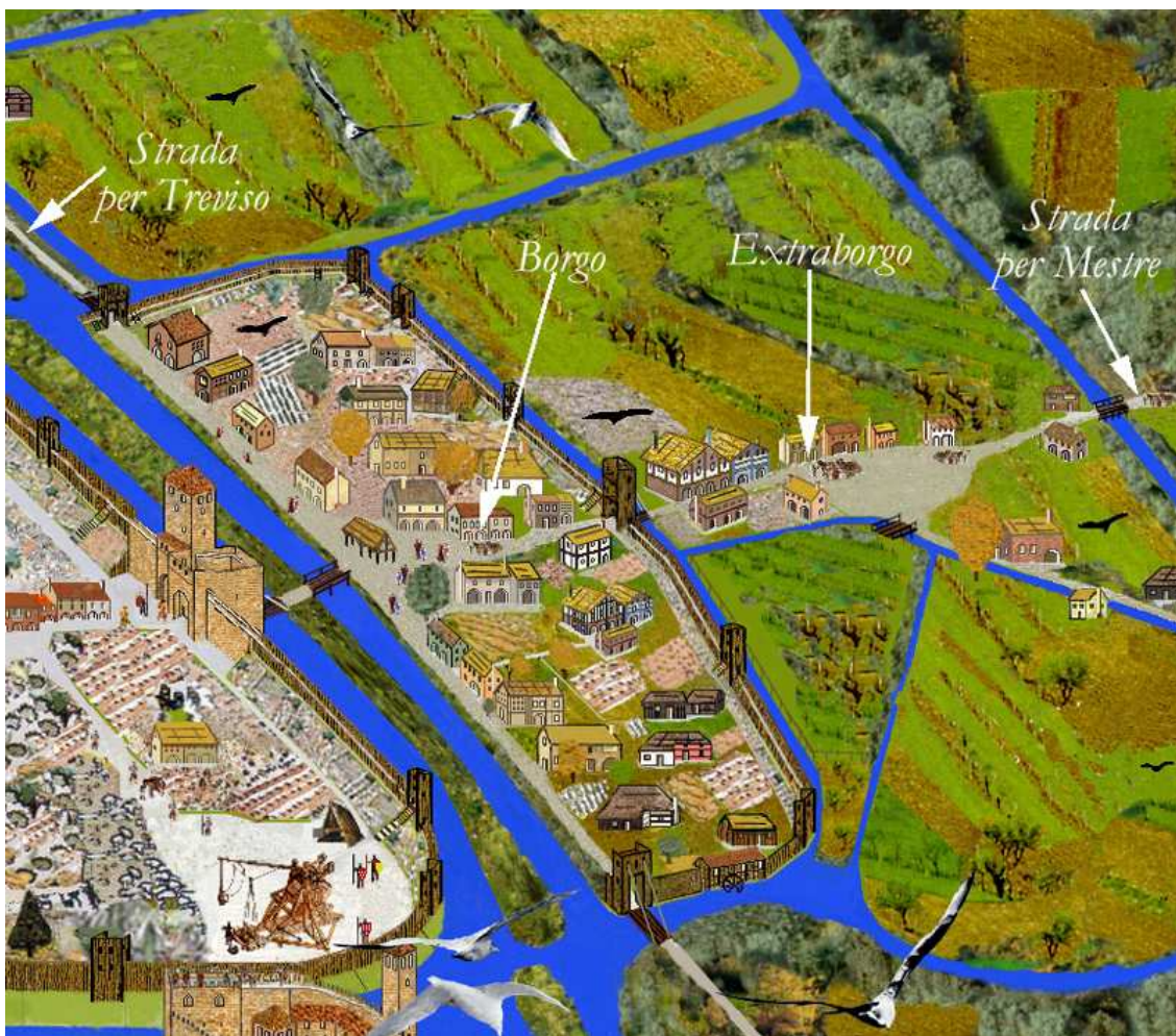
Possibile collocazione del pavion.

I documenti editi, del '200, non ci consentono di approfondire la collocazione precisa e la funzione del "pavion" del 1272, che appare più che altro un luogo di incontro dove alla domenica, giorno di mercato, si stipulavano atti notarili.