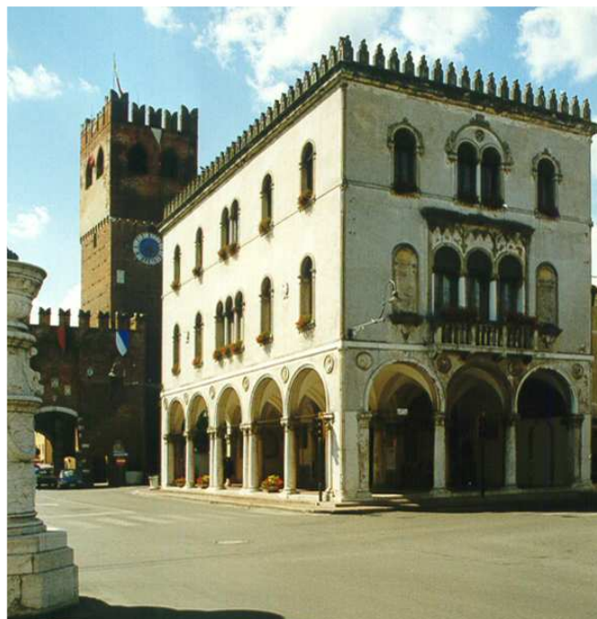
Palazzo delle loggia edificato nel 1848.

Nel 1848 sono state demolite le fabbriche del 1428 e della seconda metà del Quattrocento per edificare l'attuale palazzo della loggia, rimasto sino al 1984 -85 sede degli uffici comunali e che tuttora ospita la sala del consiglio comunale.