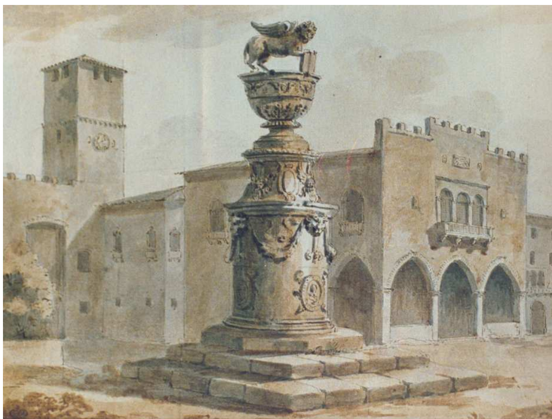
Acquerello del XVIII secolo di C.L. Clerisseau (1757/1760) VUE DE NOALE DANS LE TERRITORE DE VENISE conservato nel Museo dell'Hermitage - Pietroburgo. (Collezione Loris Vedovato).

Durante un restauro di qualche anno dopo è documentato il rifacimento della copertura della sala del consiglio e della scala di accesso esterna e nel 1557 il restauro delle merlature.