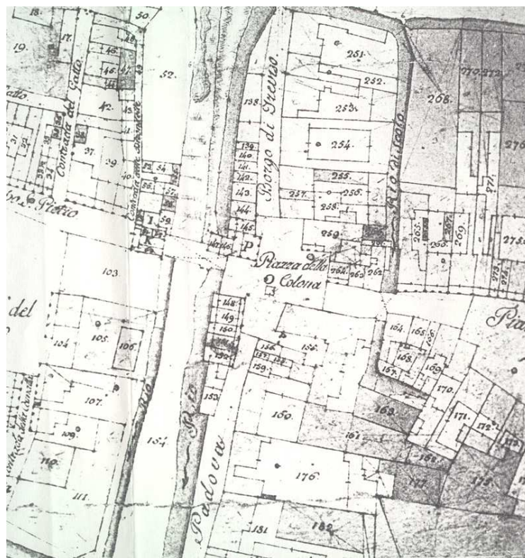
Catasto napoleonico, comune censuario di Noale, mappa n 149. Particolare. ASV