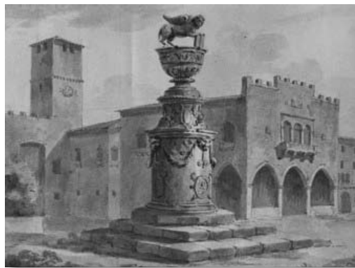
C.L. Clerissau, Vue de la ville de Noale dans le territoire de Venise, 1757-1760, acquerello, Museo dell'Hermitage, S. Pietroburgo

Il processo non ci dice quasi nulla di queste donne, tuttavia è interessante la condanna che viene loro applicata.