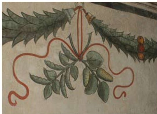
Noale, Palazzo del XVI secolo, fregio ad affresco

nome associatogli deriva dalla religione cristiana, perché secondo il calendario liturgico vi si celebra San Giovanni Battista. In questa festa, secondo un'antica credenza il sole (fuoco) si sposa con la luna (acqua): da qui i riti e gli usi dei falò e della rugiada, presenti nella tradizione contadina e popolare. Non a caso gli attributi di san Giovanni sono il fuoco e l'acqua, con cui battezzava.